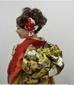
同時開催/高級呉服 オール半額セール