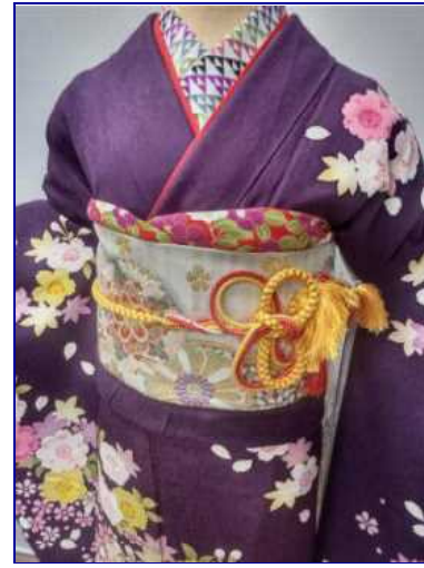
京友禅最高級振袖：¥27,500均一