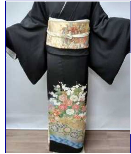
正絹京友禅留袖：¥16,500均一