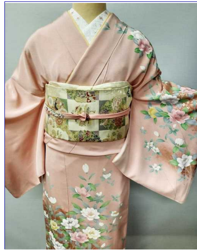
正絹京友禅訪問着：¥16,500均一